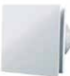
EXTRACTOR DE AIRE BIANCO