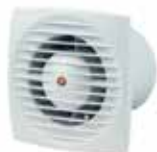
EXTRACTOR DE AIRE ANDES