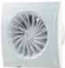
EXTRACTOR DE AIRE ASPEN