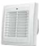
EXTRACTOR DE AIRE EVEREST