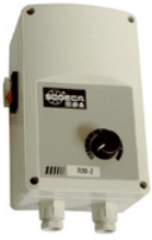
RM-1, RM-2, RM-3